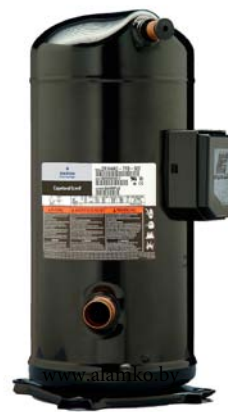
Спиральный компрессор ZR

Модельный ряд включает компрессоры различной мощности: от ZR18 (1,5 л. с.) до ZR380 (30 л. с.).